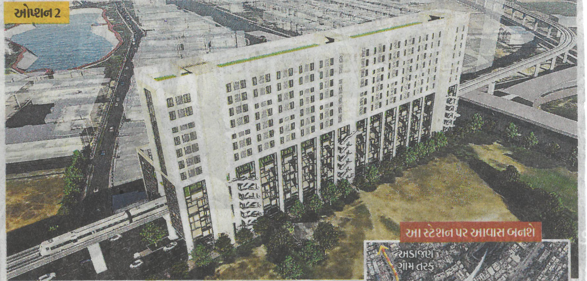
આ સ્ટેશન પર આવાસ બનશે