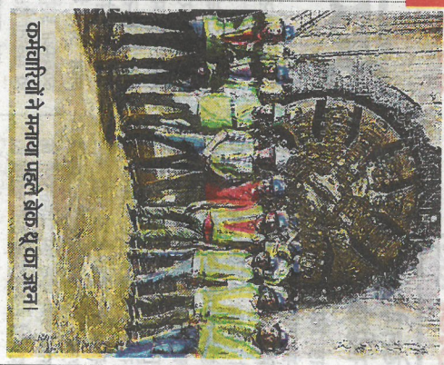
कर्मचारियों ने मनाया पहले ब्रेक थ्रू का जश्न।